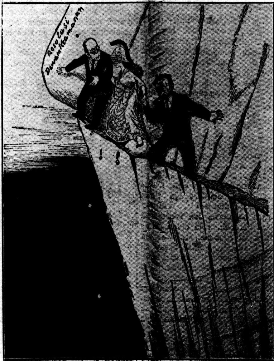
Maarseveen menunduk di mana letaknya resolusi Dewan Keamanan. ("De Vlam" 26-2).

Van Royen mempunyai kesan, bahwa katanja semua pihak sepaham konperensi media bundar baik, asal kita berhasil menjingkirkan halangan2nja. (Lanjutan ke hal. 4 lajur 6)